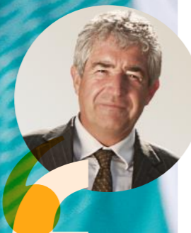
Думка незалежного експерта Тоні Джунічера

Громадський діяч, письменник, консультант з питань сталого розвитку і провідний британський еколог